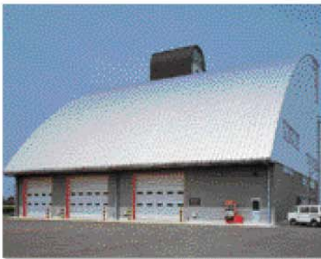
香川県農協穀類乾燥貯蔵施設