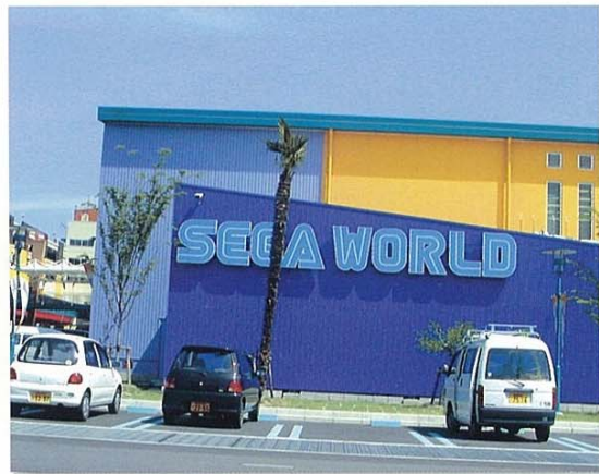
今治ワールドプラザ